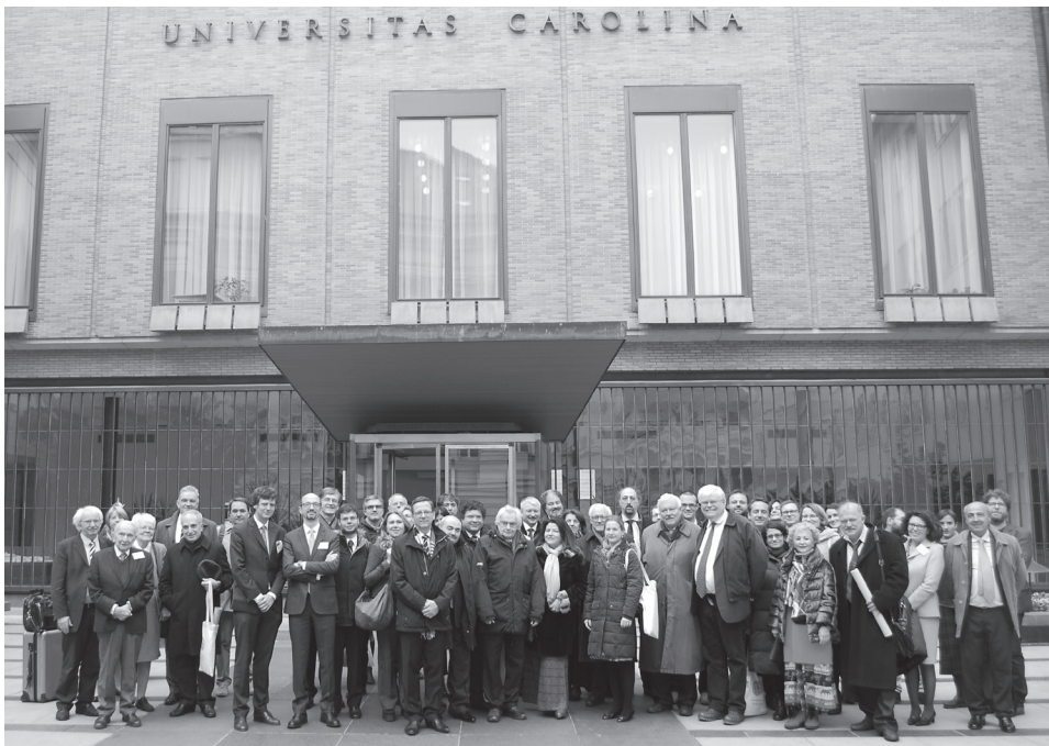
Účastníci vyhlášení ceny Premio Boulvert a zahájení konference Diritto romano e attualità před Karolinem, 20. listopadu 2019

GREGOR ALBERS, Perpetuatio obligationis. Leistungspflicht trotz Unmöglichkeit im klassischen Recht (Köln, Böhlau, 2018) p. xvi, 501.