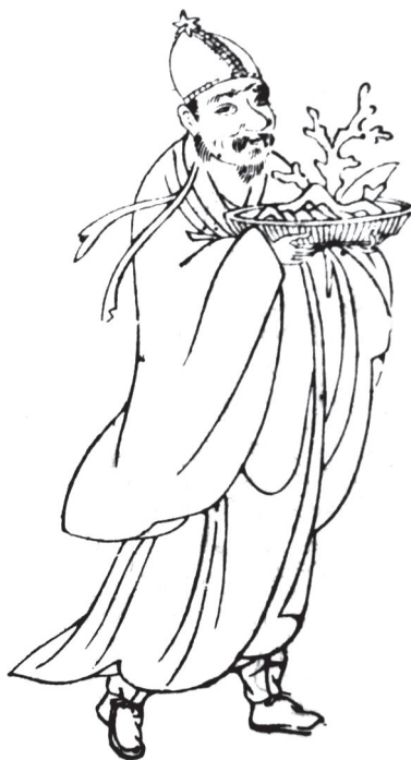
Říman ve staročínských představách