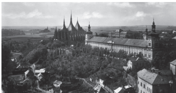
Obr. 2: Kutná Hora, 1938