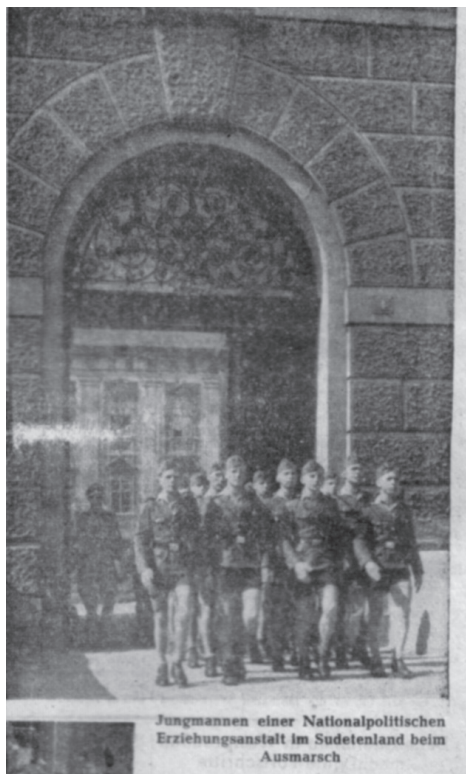
Obr. 1: Roudnice n. L. – žáci NPEA pochodující ve formaci – novinový výstřižek – AAV Praha, ca. 1943