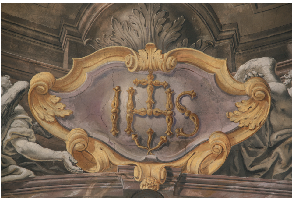
4 – IHS, detail fresky z kostela Neposkvrněného početí Panny Marie a sv. Ignáce, Klatovy, Jan Hiebel, 1716