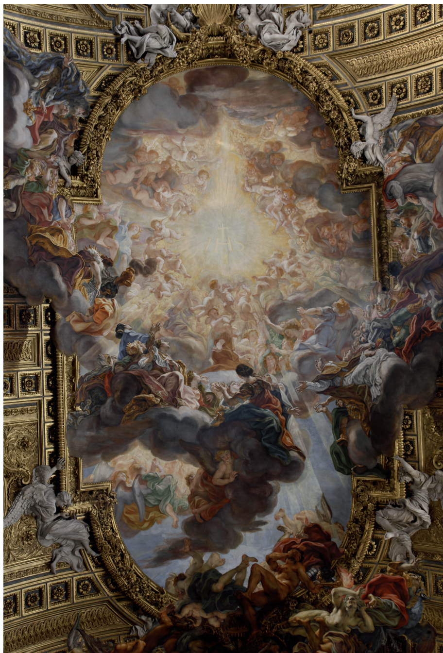
5 – Triumf Jména Ježíš, kostel Il Gesù, Řím, Giovanni Battista Gaulli, 1676–1679