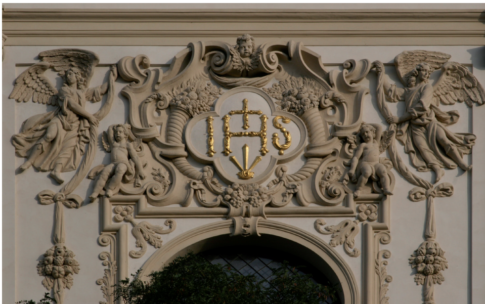
3 – IHS na průčelí kostela sv. Ignáce, Praha – Nové Město