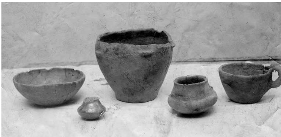
Obr. 3 Soubor pěti nádob zaslaných z muzea v Hradci Králové do Prahy jako nálezy z Dobřenic. (Uloženo v Ústavu pro archeologii FF UK.) – Abb. 3 Die fünf Gefässe, die von Museum Hradec Králové nach Prag als Funde von Dobřenice geschickt wurden. (Sammlung des Instituts für Archäologie, Karlsuniversität Prag.) (Verwahrt im Institut für Archäologie, Karlsuniversität Prag.)

ra Niederla z 9. června 1907, který tomuto Domečkovi korespondenčnímu lístku předcházal; nezdá se, že by během osmi dnů mezi daty obou dopisů proběhla ještě další korespondence 3 . Jeho text pomáhá pochopit, jak popsaná situace vznikla.