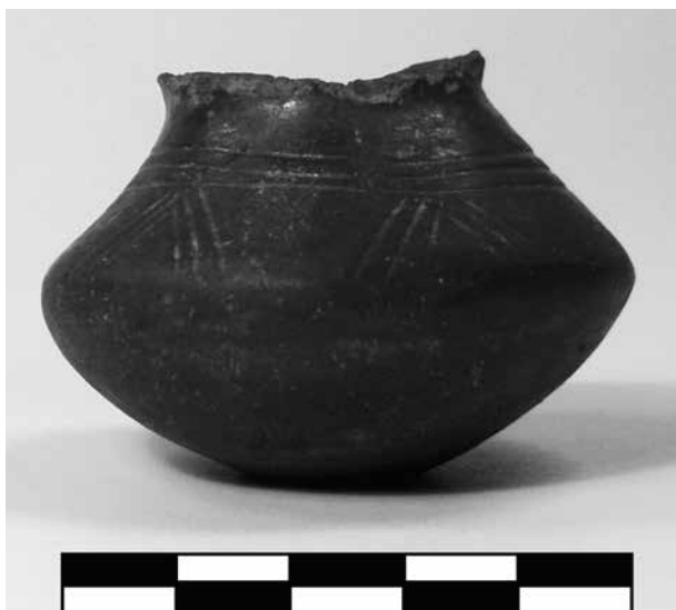
Obr. 6 Dobřenice, miniaturní nádobka č. i. 1912. – Abb. 6 Dobřenice, der Miniaturgefäß Inv. Nr. 1912.

by odpovídalo číslu „dobřenického“ souboru B 137 (v ostatních případech jsou však tato čísla psána černou tuší). Shoda s fotografií je nicméně nepochybná.