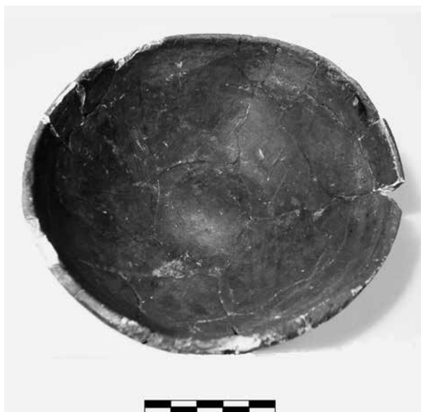
Obr. 7 Dobřenice, miska s vnitřní výzdobou, bez č. i. – Abb. 7 Dobřenice, das Schälchen mit innerer Verzierung, ohne Inv. Nr.

Zatím nenalezen zůstává hrnec (květináč), podle fotografie vejčitého tvaru s horní výdutí, se zataženým okrajem (asi z poloviny olámaným), symbolické rozhraní hrdla a těla vyznačují krátké lištovité výčnělky (vidět jsou tři, celkem mohly být čtyři) s nehtovými vrypky na hraně, výčnělky propojuje nerovná řada drobných stejných nehtových vrypů, která souvisle prochází po bocích a čelní hraně výčnělku. Podle