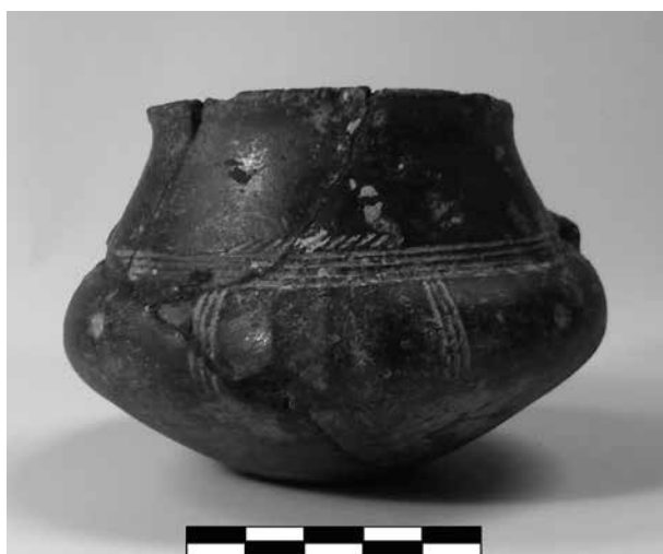
Obr. 4 Dobřenice, amforoka č. i. 1928. – Abb. 4 Dobřenice, die kleine Amphora Inv. Nr. 1928.

č. i. 1928: zapsáno pod Dobřenicemi, viz výše; jde o amforoku s typickou „slezskou“ výzdobou svazku tří vodorovných rytých linií provázených skupinami šikmých rýžek nad rozhraním hrdla a těla, na výduť pak rytých svazků tříšnití (3 linie), vymezujičích pole vyplněná buď skupinami mělkých a širokých svislých žlábků, nebo s důlkem uprostřed; vyklenutá podstava, vypuklé dno; dochováno jedno tunelovité ouško, protilehlé druhé odlomeno; pod oušky důlek; povrch tuhovaný leštěný, na spodku je tuhování patrné pouze ve stopách; v = 63 mm, max. výduť 92 mm, pr. okraje 62 mm, pr. podstavy 21 mm. Slepna ze střeplů, dochována úplně (obr. 4; tab. I: 4).