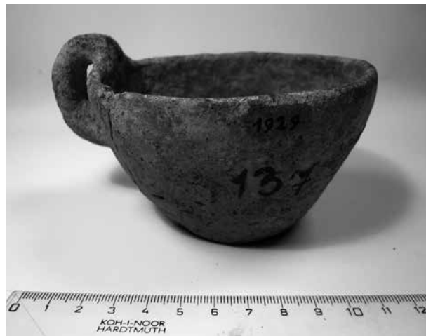
Obr. 5 Dobřenice, koflík č. i. 1929. – Abb. 5 Dobřenice, die Tasse Inv. Nr. 1929.

č. i. 1929: zapsáno pod Dobřenicemi, viz výše; jde o jednoduchý, oble rozevřený hlubší miskovitý koflík (v = 60 mm, ouško převyšeno o 10 mm nad okraj, pr. okraje 103 mm, pr. podstavy 5 cm), oproti ostatní keramice výrazně hrubě provedený – technicky se blíží spíše soudobým květináčům (síla střeplu 5 mm);