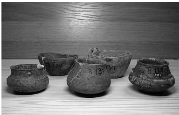
Obr. 1 Soubor pěti nádob evidovaných ve studijním sbírkovém fondu Ústavu pro archeologii FF UK pod lokalitou Dobřenice. – Abb. 1 Die fünf Gefäße aus der Sammlung des Instituts für Archäologie, Karlsuniversität Prag, die unter dem Fundort Dobřenice eingeschrieben sind.

č. i. 1929: „koflík konického tvaru, hruběji vypracovaný, s masivním uchem přečnávajícím nad okraj, barva žlutošedá, v – 6,5 cm“