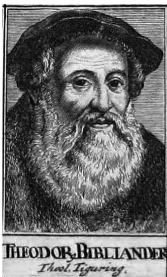
Abb. 4: Theodor Bibliander (Paul Freher, Theatrum virorum eruditione clarorum , Noribergae 1688, hinter S. 190; Knihovna Královské kanonie premonstrátů na Strahově, Sign. AZ II 7)