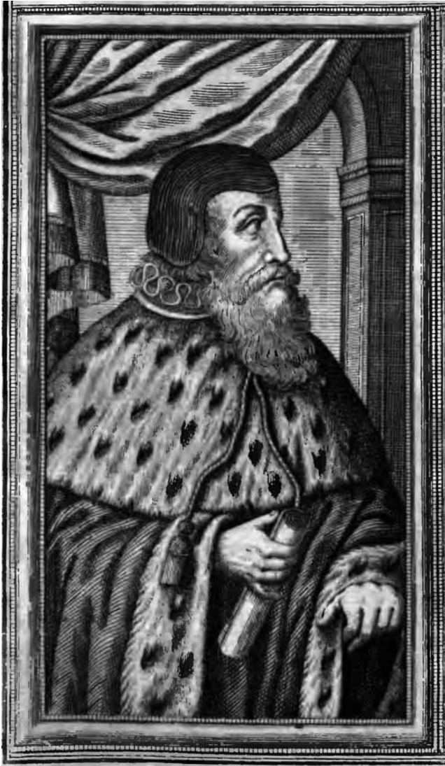
Abb. 3: Friedrich II. von Liegnitz (Georg Thebesius, Liegnitzische Jahr-Bücher ..., Teil I, Jauer 1733, hinter s. 54; Knihovna Národního muzea, Sign. 43 A 20)