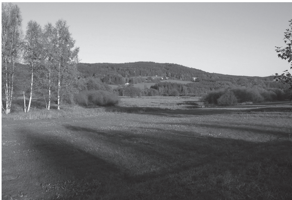
Obr. 2a a 2b: Charakteristické prvky krajiny Vysočiny (rozehlá zvlněná pole, louky a pastviny lemované zalesněnými kopci, osamocené působící řídké rozesté vesnice s rybníky) našly svůj odraz v motivech regionálních malířů, kteří jejich reprodukcí přispěli ke tvorbě krajinářského stereotypu Vysočiny.