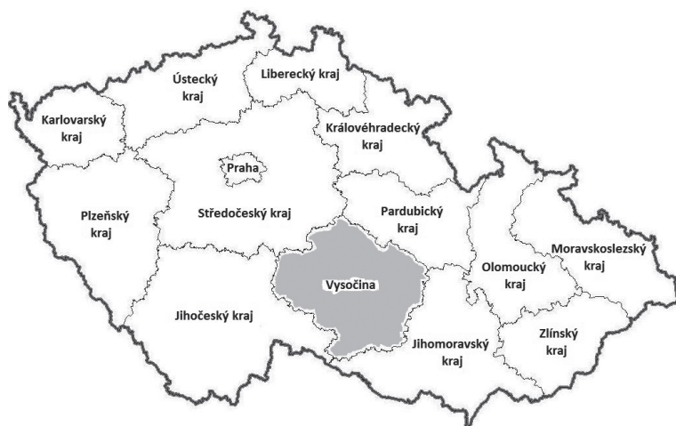
Obr. 4: Mapa krajů České republiky od r. 2000.

Pozn.: Při srovnání s Obr. 1 je zřetelné, že administrativní hranice kraje Vysočina neodpovídají geografickým hranicím Českomoravské vrchoviny.