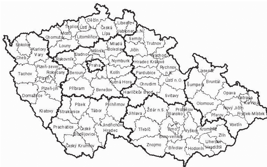
Obr. 3: Mapa krajů a okresů ČSSR podle územně-správní reformy z roku 1960.

Aby mohly být „bourdieuovské“ mechanismy vytváření a sebereprodukce regionů lépe přiblíženy, pokusíme se je promítnout na příklad regionu Vysočina. Jak jsme již poznali, tento region má zřetelnou identitu vybudovanou na základě svého geografického charakteru, který je víceméně stálý. Naopak administrativních proměn může geografické území zažít mnoho i v krátké době. Jak se tedy proměňuje ona složka identity, na jejíž formování a fungování má správní charakter „regionu“ vliv?